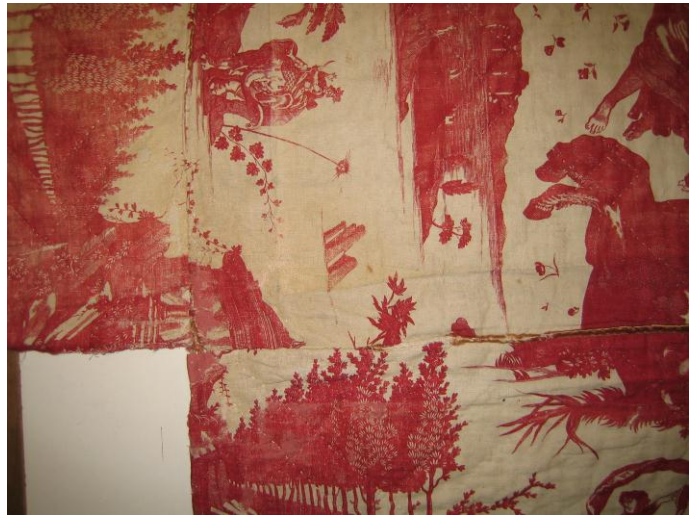
restauration d'un des coin de la courtepointe