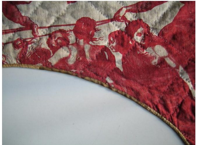
restauration du ruban de soie avec du ruban organza