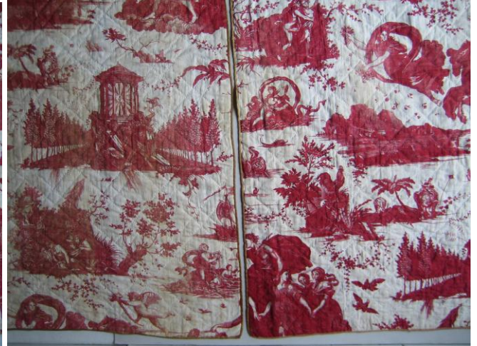
Les deux pentes lavées