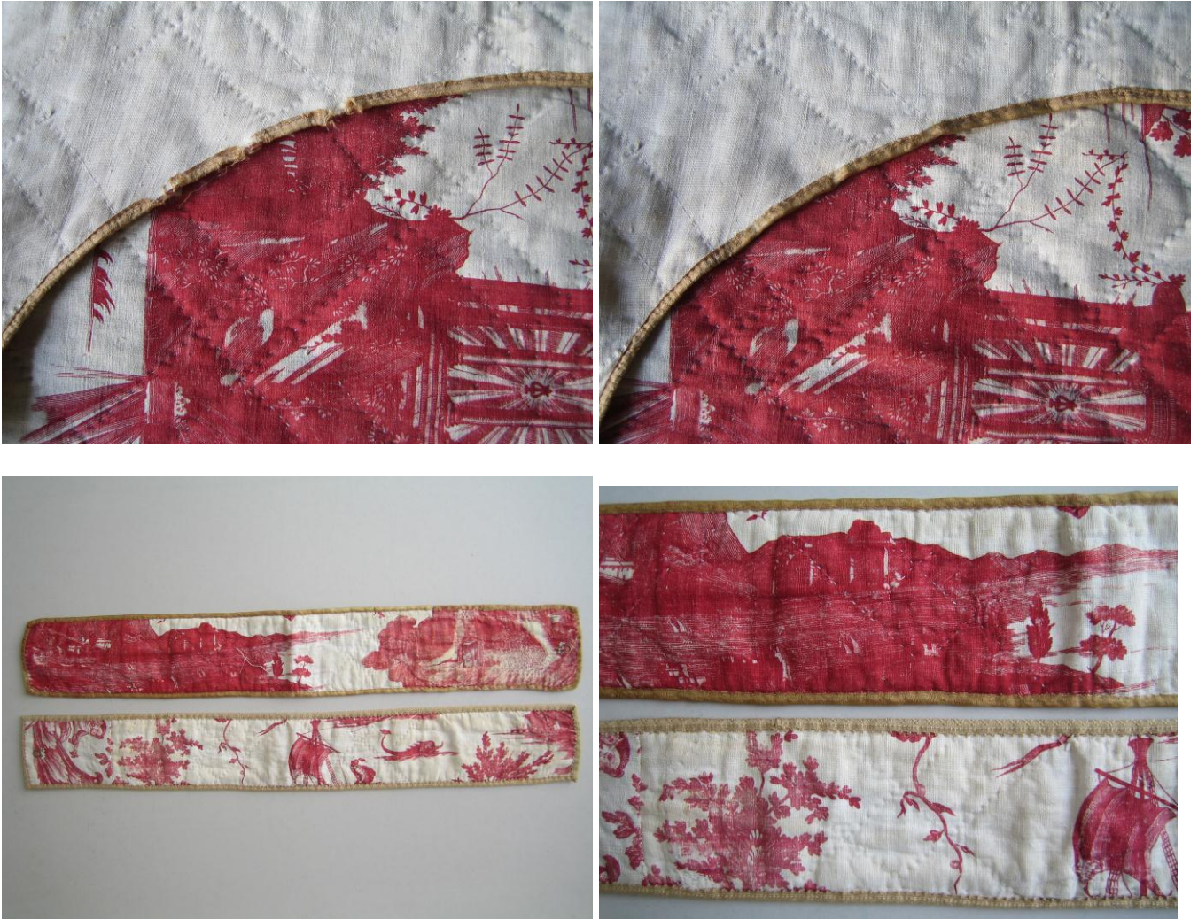
Restauration des embrasses