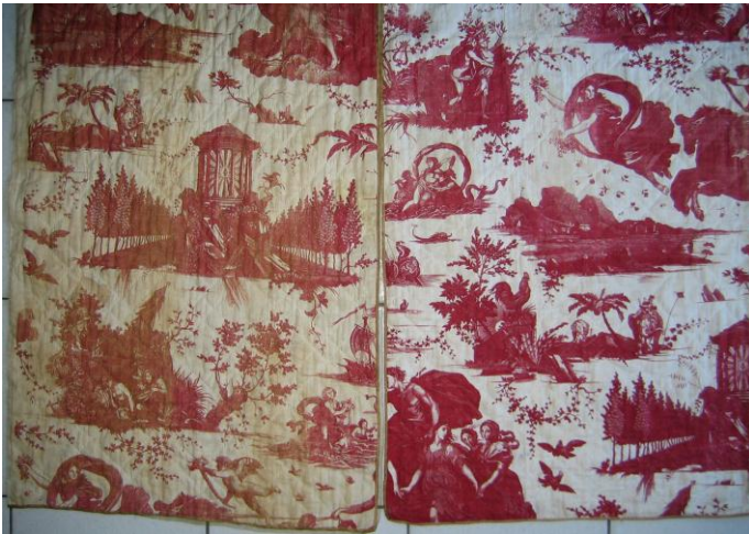
pente gauche avant lavage, pente droite lavée