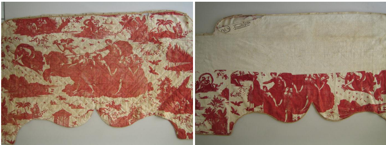
lambrequin extérieur, petit côté, endroit et envers (avant traitement)

Sur le côté face (petit côté) et sur le côté droit le motif du char de l'aurore est bien centré ; Le côté gauche, en revanche, est constitué de plusieurs morceaux assemblés, il a été confectionné avec les chutes.